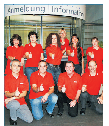
Das Team der Kundenbetreuung der Stadtwerke Völklingen

werke Völklingen. Das ist nicht fair. Ich würde es begrüßen, wenn man einen gerechten Umgang im ohnehin schon schwer zu verstehenden Strom- und Gasgeschäft praktizieren könnte.“